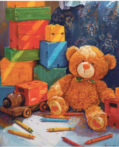
Pintura del cartel de «Infancia»