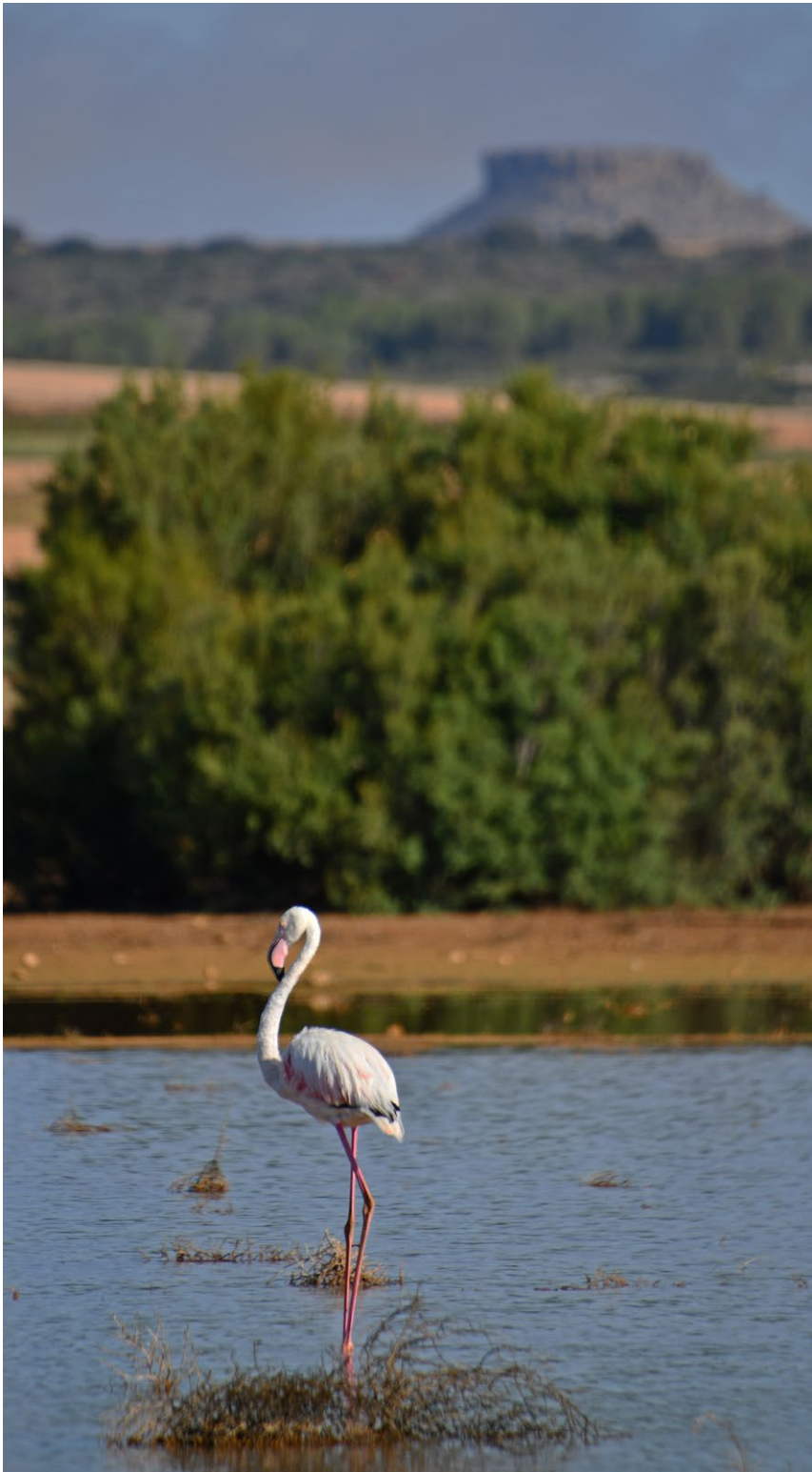
A la izquierda, flamenco común. A la derecha, cigüeña común. En el recuadro, Antonio Guillén

El tercer objetivo del festival es la promoción del entorno rural. En una España que lucha contra la despoblación, eventos de este calibre sitúan a municipios pequeños en el foco mediático y turístico. Para Guillén, el simple hecho de que los nombres de Corral Rubio, Pétrola e Higuera de las Aves aparezcan en los medios y mapas las semanas previas ya es un triunfo. «Se trata de dinamizar un entorno rural... Que surjan contactos, que alguien le interese o le guste y se quiera quedar a vivir», comenta con esperanza.