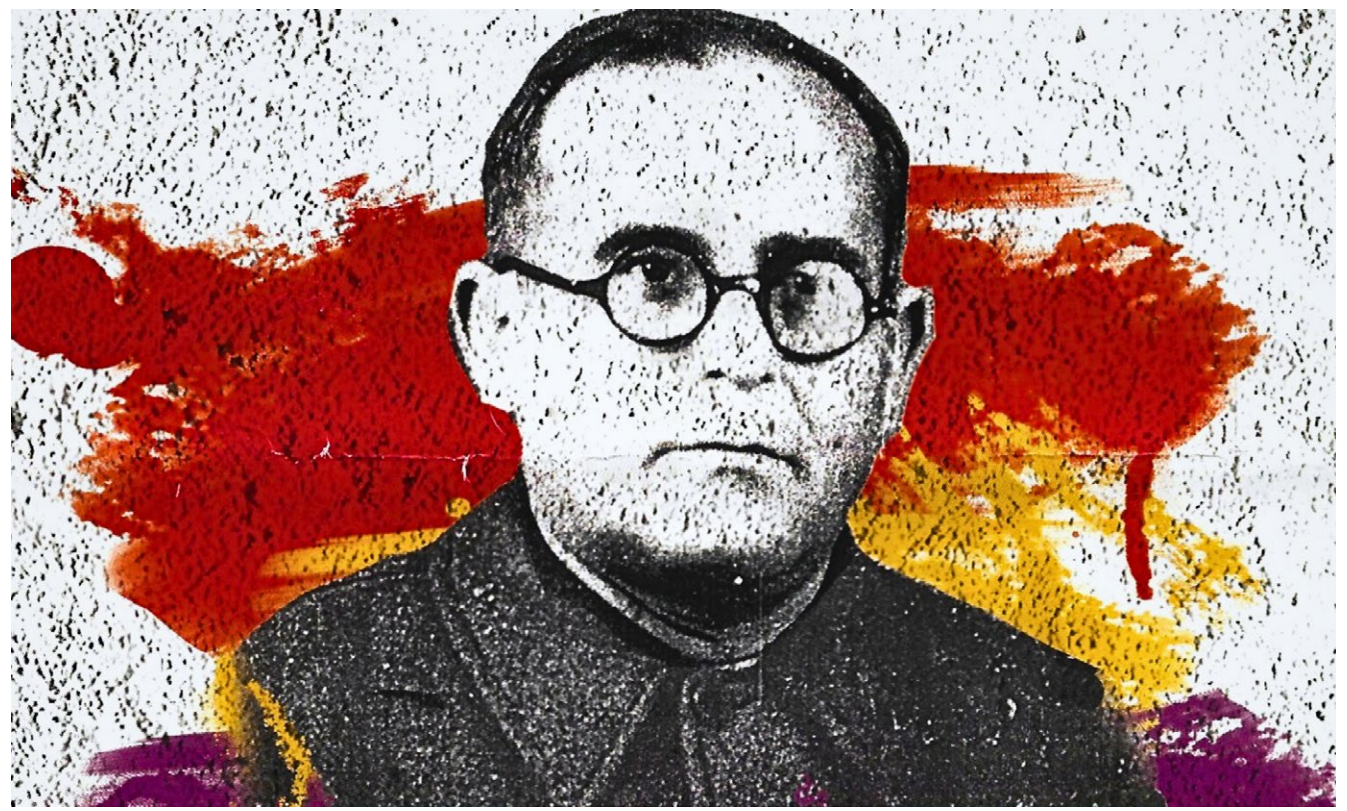
Arriba, cartel de la obra Un hombre bueno | COMPAÑÍA ALMATEATRO