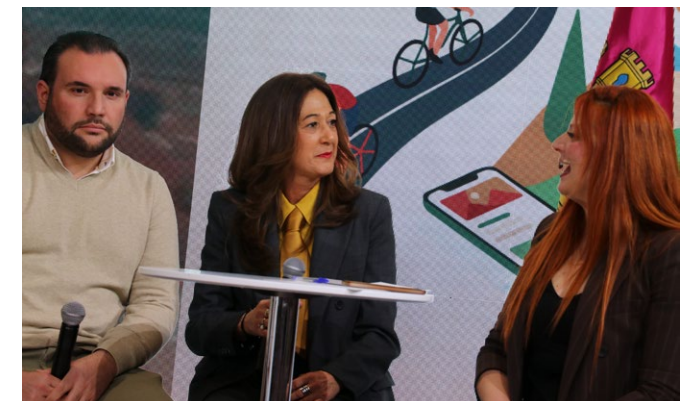
Callado: «Un año más estamos en FITUR por méritos propios»

La agenda de la Diputación se completó con la firma de un protocolo de colaboración con Valladolid para impulsar el turismo gastronómico, una línea que busca crear redes entre empresas, promover eventos conjuntos y reforzar la proyección de los productos locales entre las dos capitales.