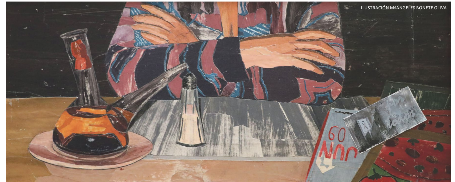
ILUSTRACIÓN Mª ÁNGELES BONETE OLIVA

El Castillo de Almansa sabe lo que es resistir. A comienzos del siglo XX estuvo a punto de ser derribado, herido por las canteras del Cerro del Águila y por una declaración de ruina. Pero voces valientes lo defendieron, consiguieron una Real Orden de Monumento Histórico Nacional, salvándolo para siempre. Resistencia similar volvió en 2014, cuando una gigantesca pancarta con un lazo rosa, creada por la artista local que firma la ilustración de este mes, colgó de su torre para apoyar a quienes luchan contra el cáncer y abrazar con amor a familias, amigos y recuerdos que jamás se rinden. Que saben resistir.