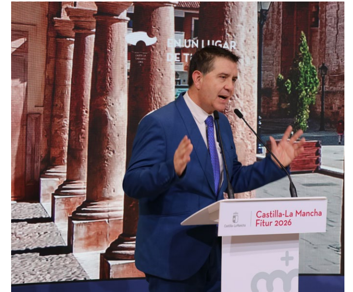
Cabañero: «Somos la provincia que más crece en turismo de interior»