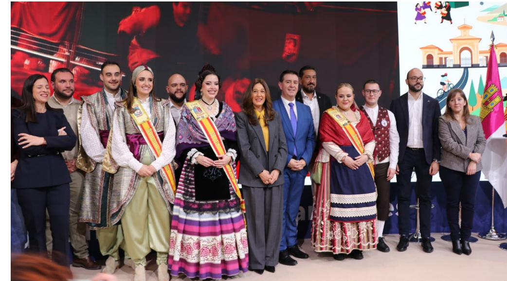
La comitiva almanseña representó a la ciudad con excelencia y un genial ambiente | V.GIL