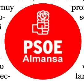
INFORMACIÓN REALIZADA DE FORMA ÍNTEGRA POR EL GRUPO MUNICIPAL PSOE

La ciudad de Almansa dispondrá en el año 2026 del mayor presupuesto de toda su historia. El gobierno de Pilar Callado gestionará más 33 millones de euros, un presupuesto municipal que reforzará los servicios públicos, será solidario e inversor. De hecho, con una previsión muy cercana a los 5 millones de euros, 2026 será un año de inversiones récord, con la continuidad del plan de asfaltado y acerado y los proyectos de fondos europeos. Cinco millones que se dedicarán a la renovación de kilómetros de infraestructura viaria, a vivienda de alquiler, con el inicio de la rehabilitación de 'Los Peones' y a infraestructuras sociales, con la ampliación del centro de día de enfermos de Alzheimer, y culturales, como