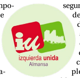
INFORMACIÓN REALIZADA DE FORMA ÍNTEGRA POR EL GRUPO MUNICIPAL IU

Desde la apertura del Centro socio-sanitario de la calle Hellín en el año 2017, incumpliendo ya los mínimos de accesibilidad y tras años de reivindicación, queremos poner en valor una mejora que se ha puesto en marcha. A petición de las personas que componen el centro, se han instalado espejos terapéuticos que permitirán desarrollar distintas intervenciones especializadas. Concretamente, de estos espejos serán una herramienta esencial en intervenciones de terapia ocupacional, fisioterapia, logopedia y psicomotricidad, mejorando la calidad de los varios tratamientos que se llevan a cabo. Su uso resulta imprescindible para trabajar la concienciación postural. Esta mejora supone un avance notable en la atención y rehabilitación de las personas usuarias del centro. La actuación se suma a otras mejoras ya encargadas como la instalación de nuevas puertas de entrada y salidas de emergencia adaptadas, que cumplan con la normativa y eliminen las limitaciones actuales, avanzando así a un centro más accesible, seguro y funcional. Desde Izquierda Unida defendemos que la accesibilidad es un derecho. Garantizar que los espacios socio-sanitarios sean plenamente utilizables es una cuestión de justicia social y de igualdad de oportunidades. Como Concejalía de Servicios Sociales, trabajaremos para que los recursos públicos sean espacios dignos, accesibles y adaptados a las diferentes necesidades de las personas.