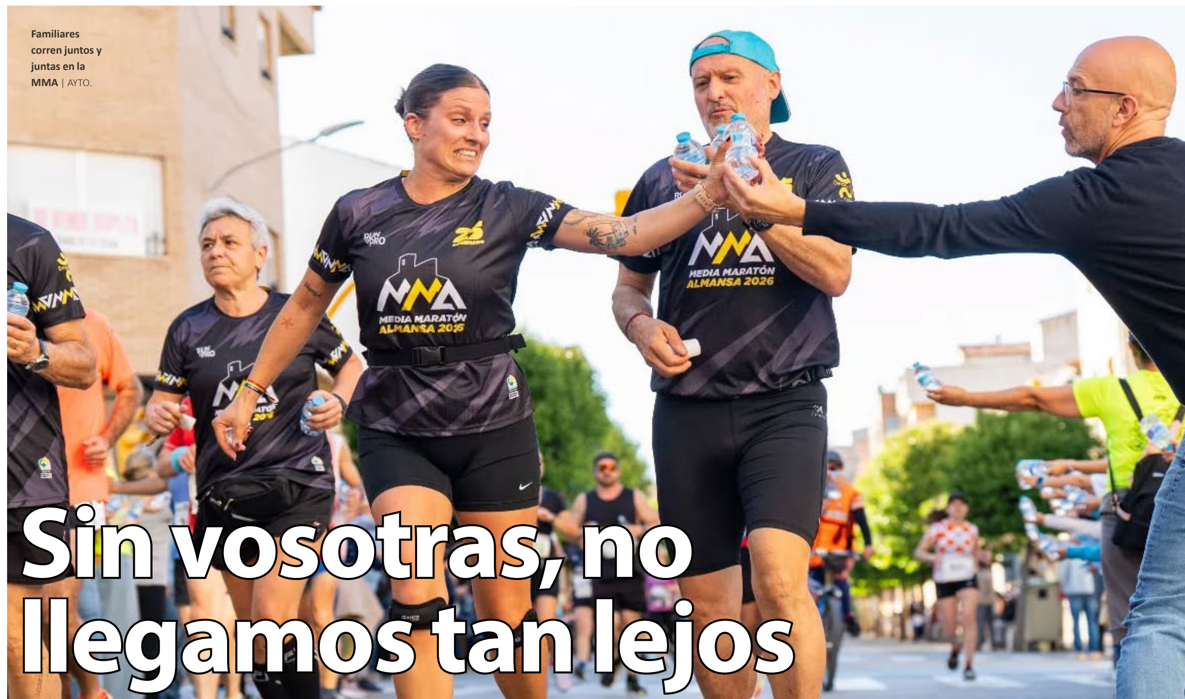
Familiares corren juntos y juntas en la MMA | AYTO.