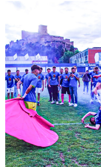
Momento de la celebración