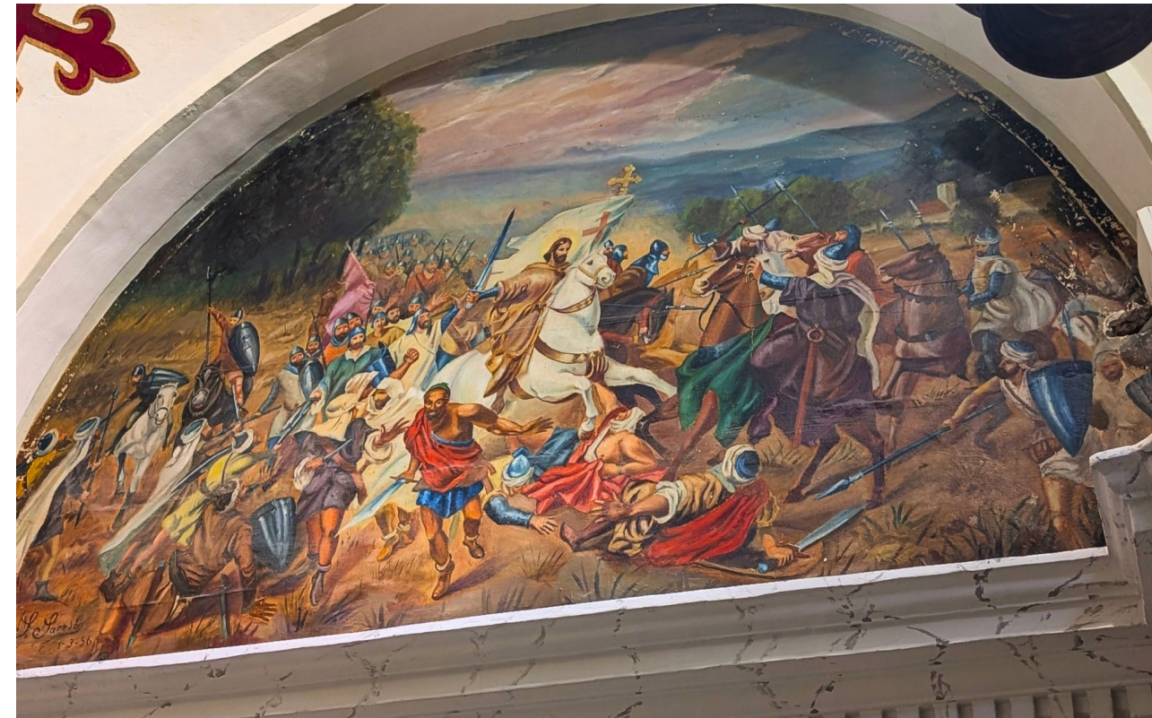
Fresco ubicado en la primera capilla-hornacina a la izquierda al entrar en el convento, junto a la imagen de Santiago

El 8 de junio de 1996, Almansa volvió a abrir las puertas a uno de sus silencios más hermosos, más asombrosos. Tras más de un año de restauración, reabría la Iglesia de Santiago Apóstol. ¿La conoces? Seguro que no, porque casi nadie la llama así. Para la vecindad es y seguirá siendo, sencillamente, «Los Franciscanos». Anécdota que refleja una lástima: todos lo conocen, pero muy pocos saben realmente lo que entraña. Fue fundado en 1563 por Fray Antonio de Llerena, alrededor de la antigua ermita de Santiago. Desde entonces, este rincón ha sobrevivido a traslados, disputas políticas, clausuras, expulsiones, guerras y abandonos. Ha sido convento austero, escuela pública, academia de música, parroquia provisional y hasta garaje de las Brigadas Internacionales durante la Guerra Civil. Pocas piedras de la comarca podrían contar una biografía semejante. A nivel artístico, el actual templo barroco (simple pero al fin y al cabo barroco), iniciado hacia 1660, conserva una sobriedad casi castellana en su fachada, pero sorprende al visitante cuando cruza el umbral. Allí aparecen frescos escondidos como regalos tardíos, rincones cubiertos de inscripciones misteriosas y unos antiquísimos azulejos que sobreviven al tiempo con más