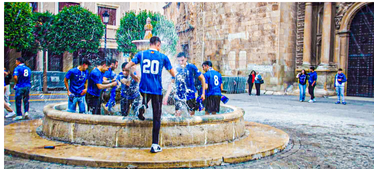
El club celebra su ascenso matemático el 10 de mayo, en la plaza de Santa María | J.M.G