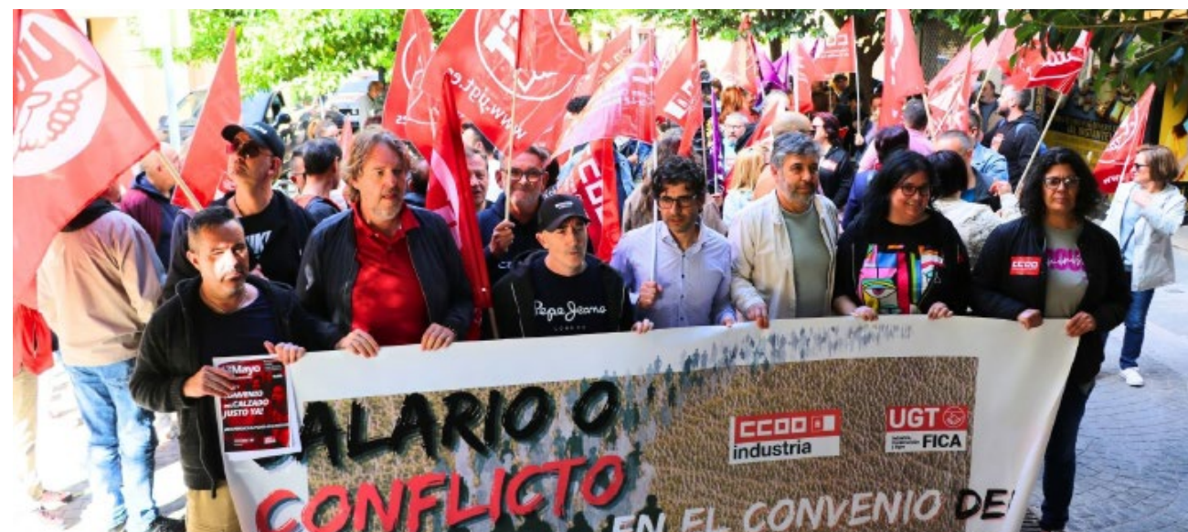
Más de 200 personas en un notable movilización de CCOO y UGT previa a la última reunión de negociación