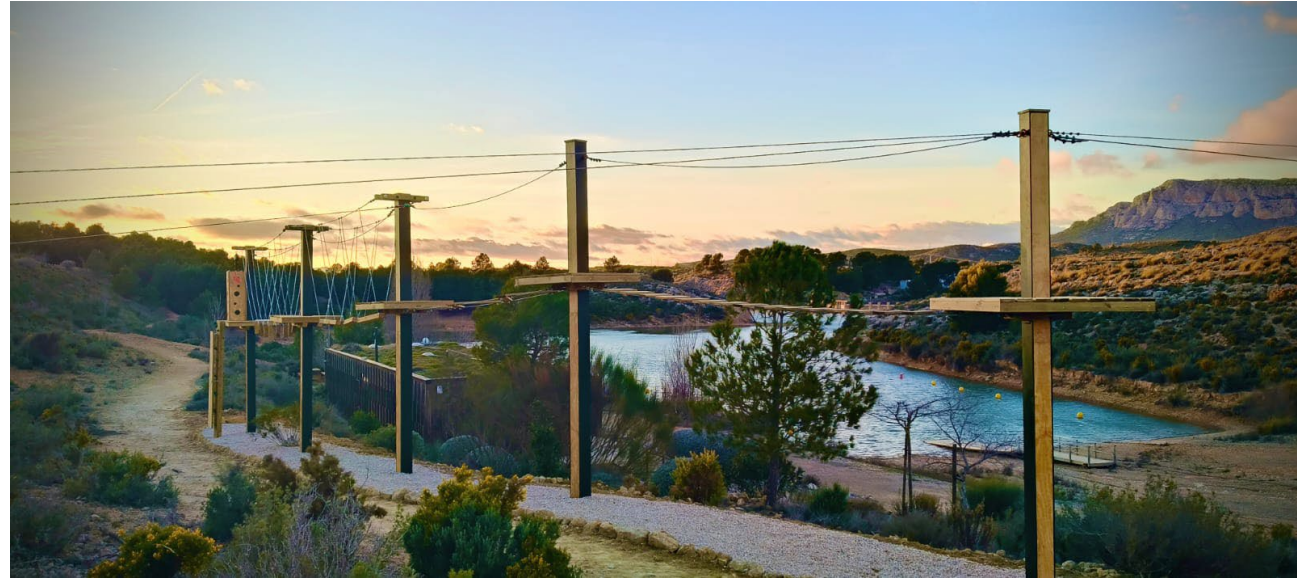
Imagen aérea del parque multiaventura