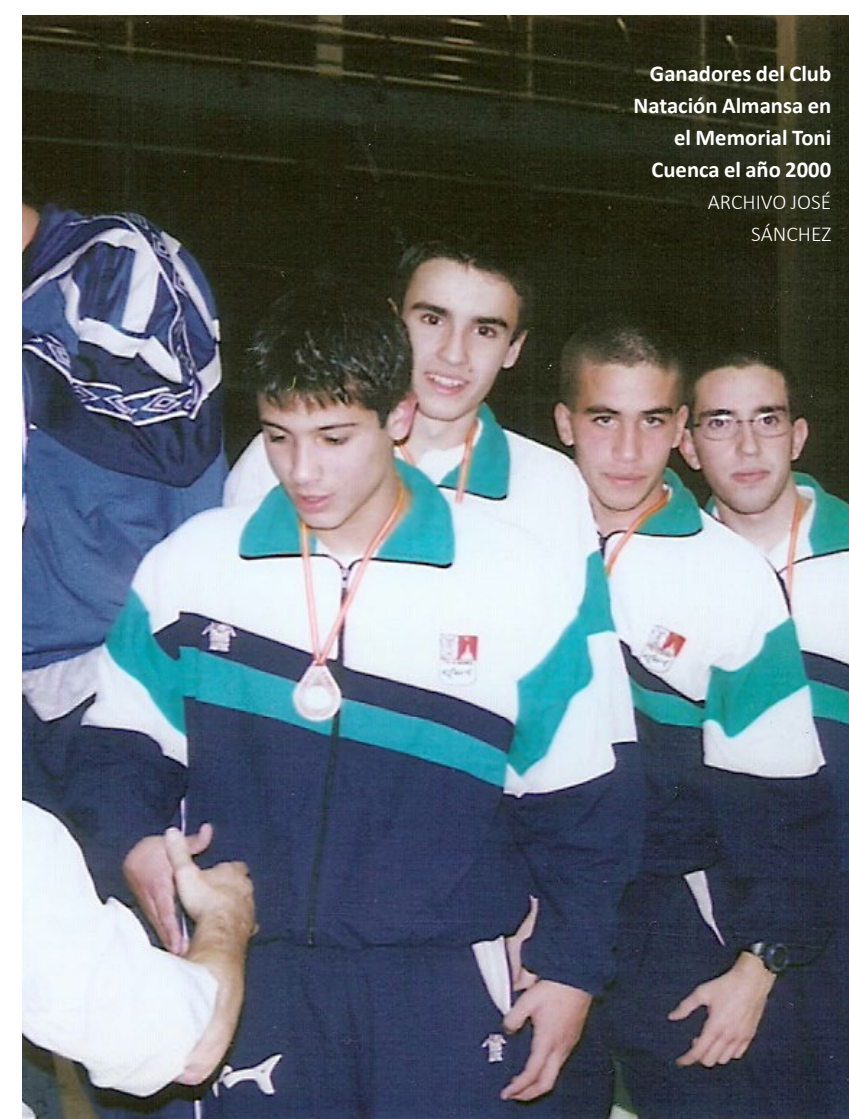
Ganadores del Club Natación Almansa en el Memorial Toni Cuenca el año 2000

Para el director técnico, la natación ofrece beneficios que van mucho más allá del desarrollo físico o la capacidad aeróbica: «es el deporte más completo de todos». En un mundo saturado de estímulos y tecnología, el agua ofrece un espacio de «conexión contigo mismo... De dejar al lado la vorágine de información y el caos», reflexiona Sánchez, animando a todo el mundo a lanzarse a la piscina para experimentar esa sensación de relax y disfrute.