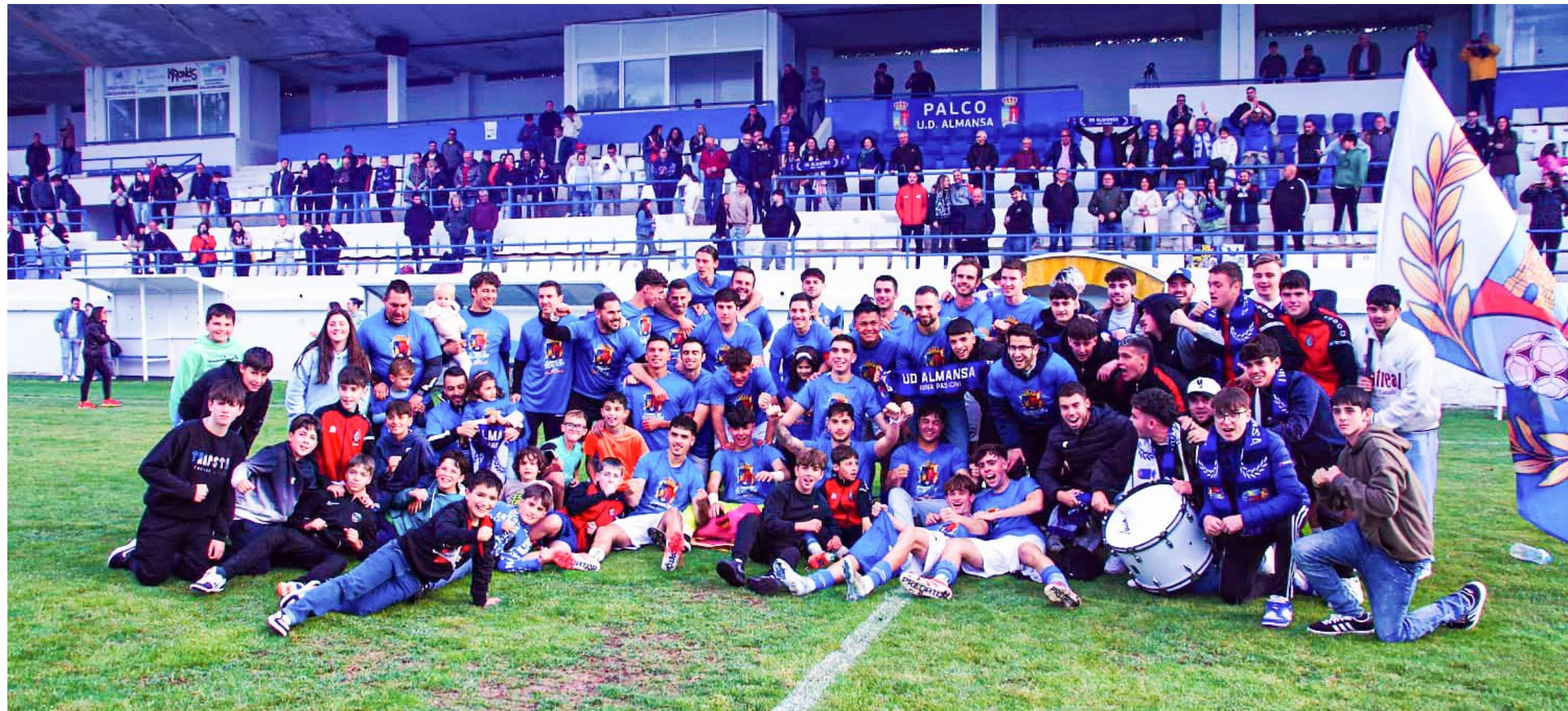
El equipo celebra la subida junto a la afición, en el césped del Paco Simón, al finalizar el encuentro con el Daimiel Racing CF | JOSÉ MANUEL GARCÍA

La Preferente ya es pasado y la UD Almansa vuelve a ser de Tercera División. Toca disfrutar de lo sembrado y volver a creer, porque el escudo ha vuelto a su lugar y, con este ascenso, volveremos a revivir nuevas tardes de gloria.